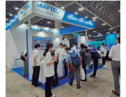
新規需要開拓に向け、2次電池の製造・開発に関する展示会「BATTERY JAPAN」に出展した

ます。車体底部に搭載した蓄電池が発火した際に、車内空間を保護するための遮炎材の需要です。